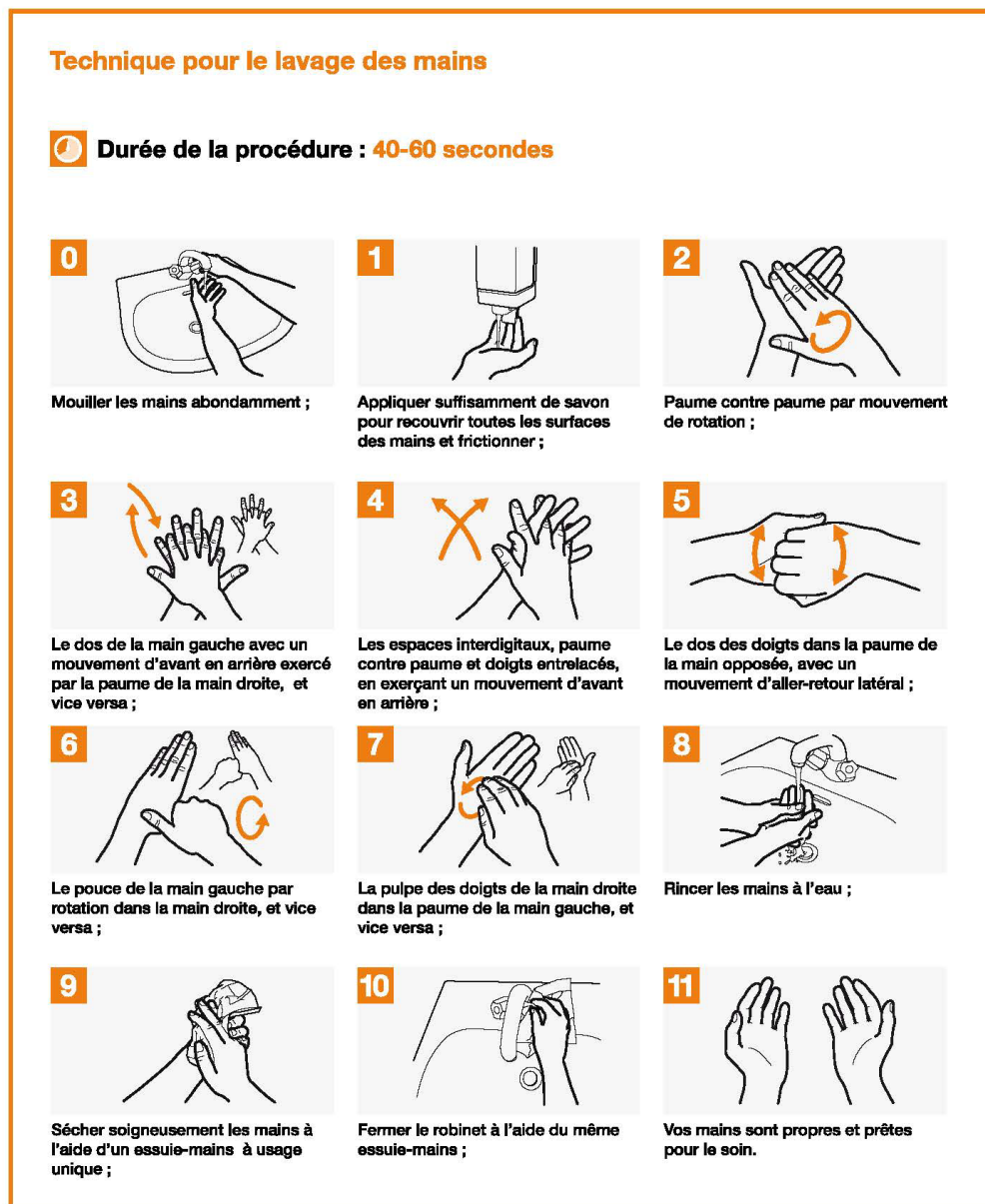
Figure II.2 Technique pour le lavage des mains

2. Désinfectant pour les mains : Si l'employé ne peut se laver les mains avec de l'eau et du savon, il peut utiliser un désinfectant pour les mains qui contient au moins 60 % d'alcool.